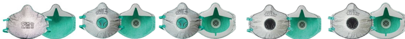
BLS Zer0 30 NV