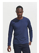
SOL'S Imperial LSL MEN 02074